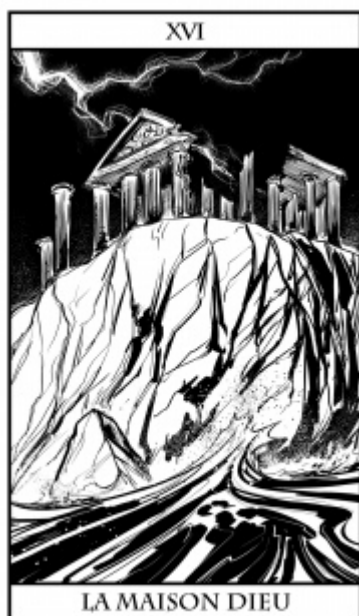
Illustration Jean-Marie Minguez

©Kyklos Editions, Jean-Marie Minguez Tous droits réservés