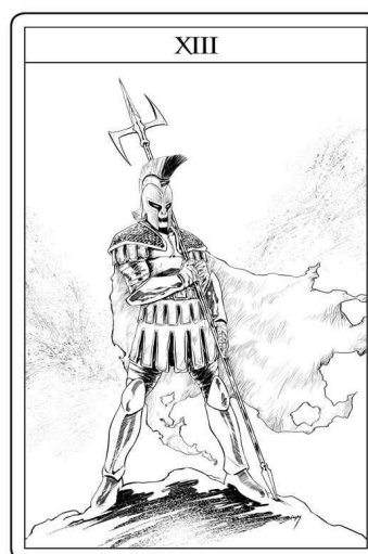
Illustration : Jean-Marie Minguez